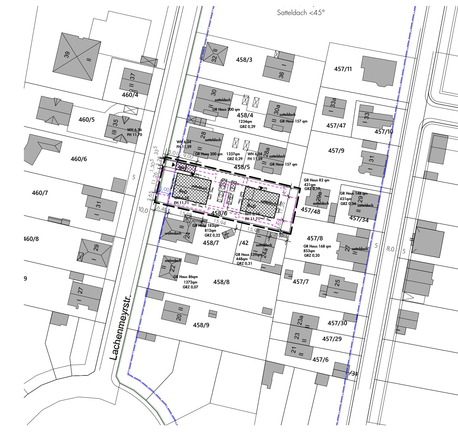
lageplan m 1:1000